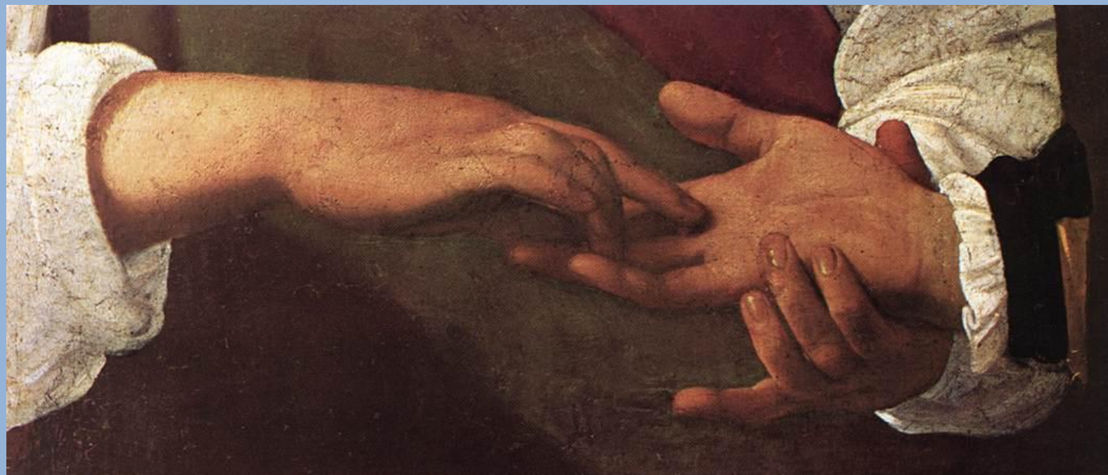
Buona Ventura (particolare), Caravaggio, 1593 - 1594